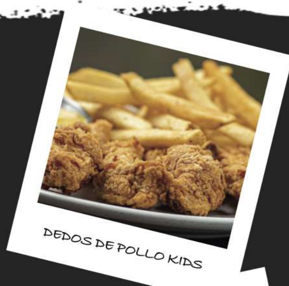
DEDOS DE POLLO KIDS