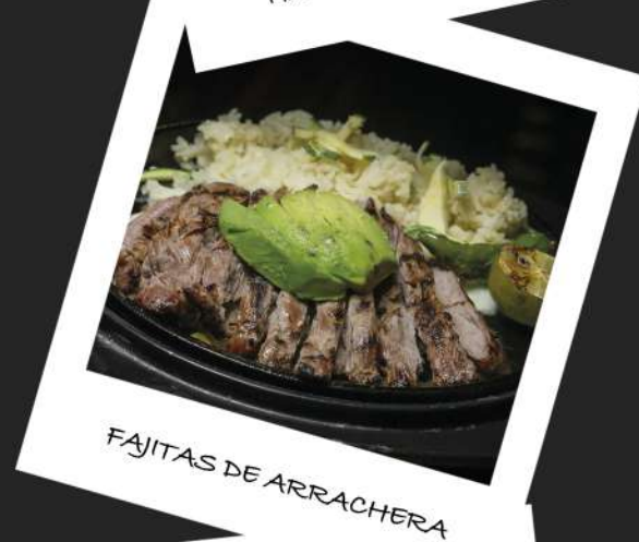
FAJITAS DE ARRACHERA