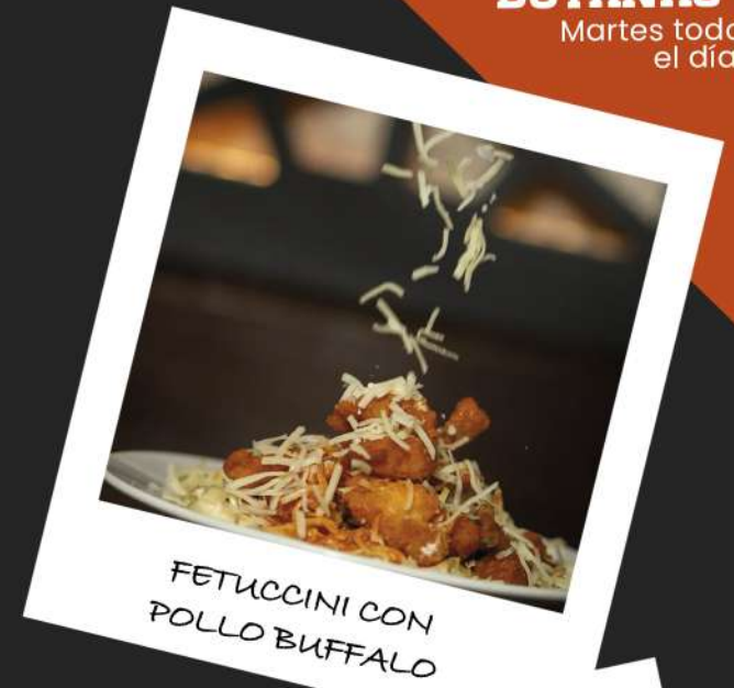
FETUCCINI CON POLLO BUFFALO