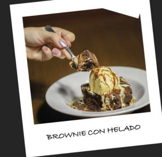
BROWNIE CON HELADO